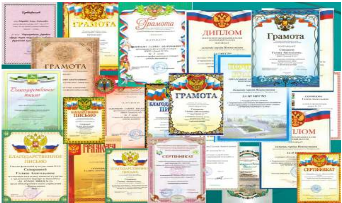
Грамоты и дипломы наших спортсменов.