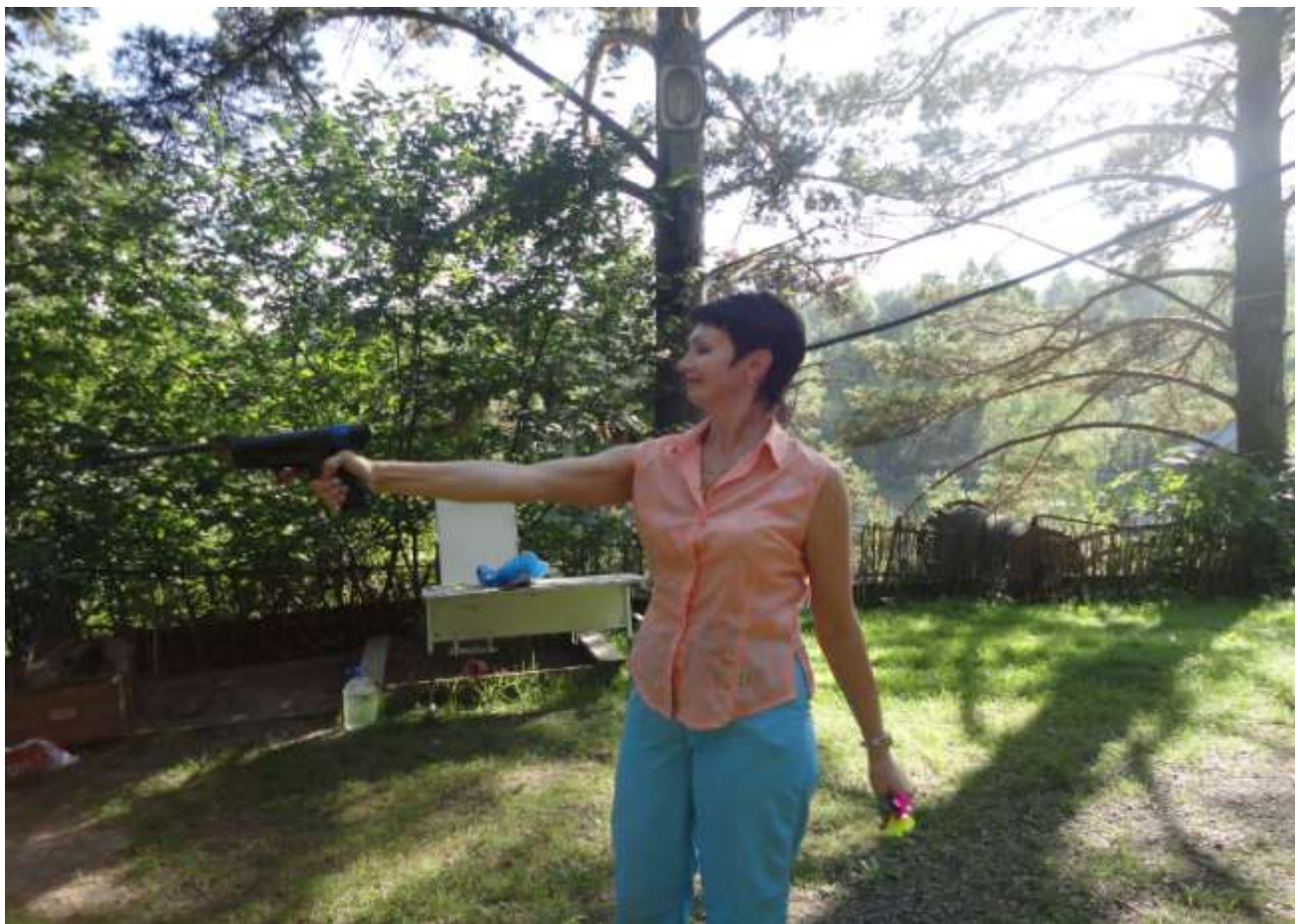
Соревнования по стрельбе среди учителей Центрального района.