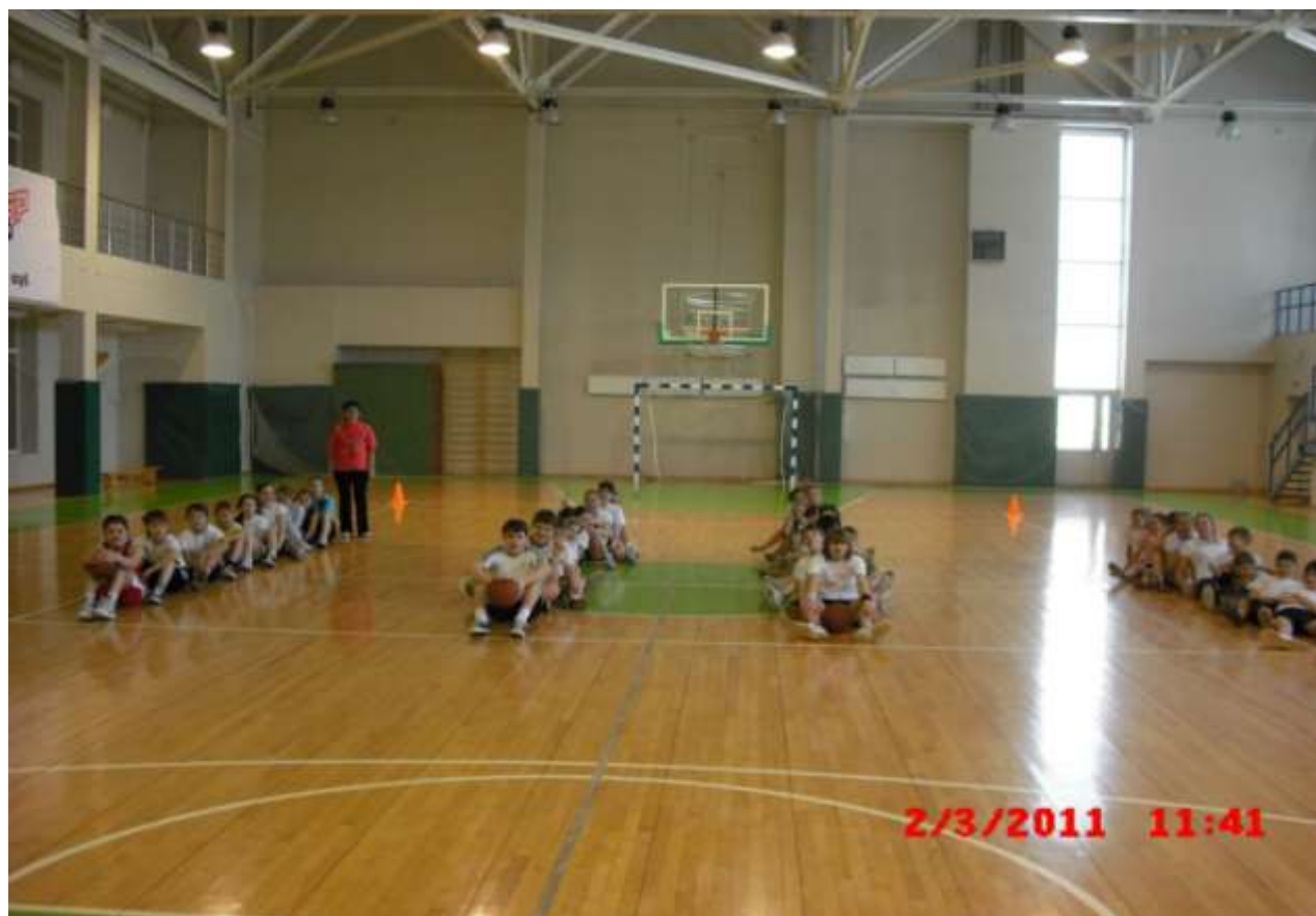
«Веселые старты» среди 6-х классов.

В 2006 году было набрано всего 12 классов. Была возможность проводить больше соревнований среди классов: «Веселые старты», «Мама, папа и я – спортивная семья», турниры на приз «Деда Мороза», соревнования по баскетболу и волейболу, где всегда отлично поддерживали свои команды болельщики. А среди них родители, бабушки и дедушки, братья и сестры, всем же хотелось еще и спортивный зал посмотреть!